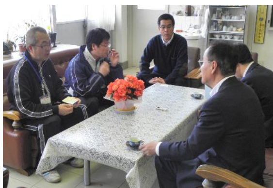
【原町第三小学校訪問】