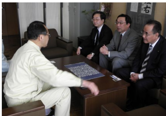
【岩手県教育委員会教育長(左)との懇談】