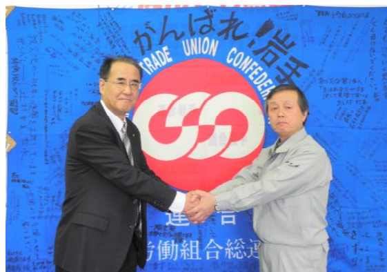
【連合岩手 砂金会長(右)訪問】