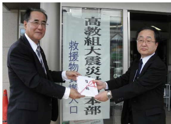
【岩手高教組上田委員長(右)】