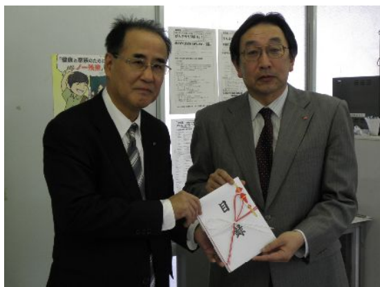
【岩手県教組豊巻委員長(右)】