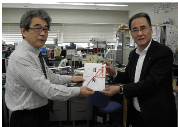
【宮城県教組齊藤委員長（左）】