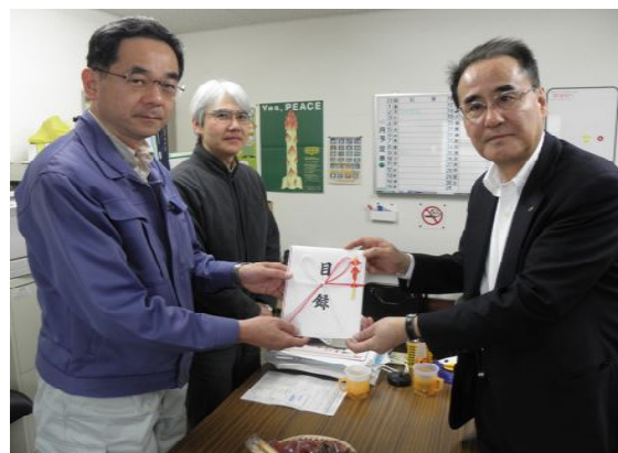
【宮城高校ネット板橋事務局長（左）】